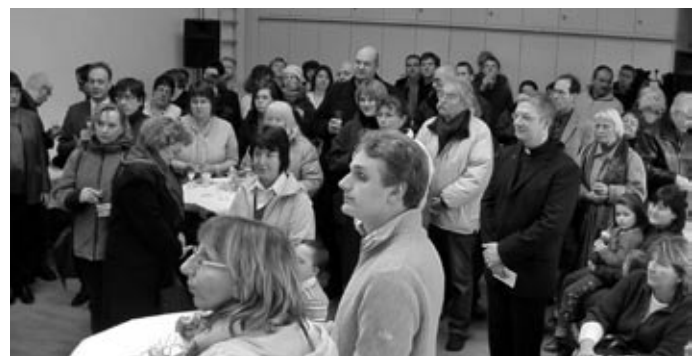
Gäste beim Sektempfang.