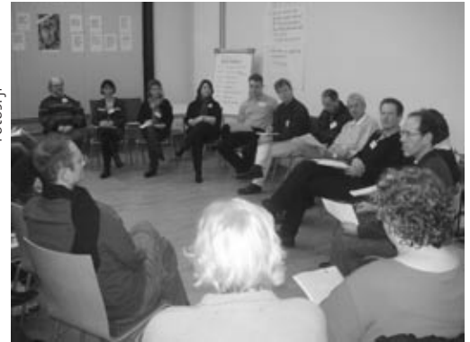
Austausch über die Gruppenergebnisse