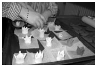
Alle Kinder durften zu Beginn eine Königskrone basteln.