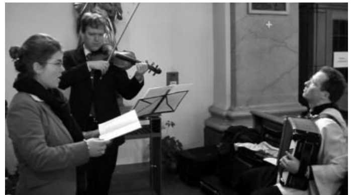
Jüdische Lieder während der Kommunion.