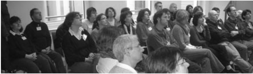
Großes Interesse am Evangelisierungs-Workshop