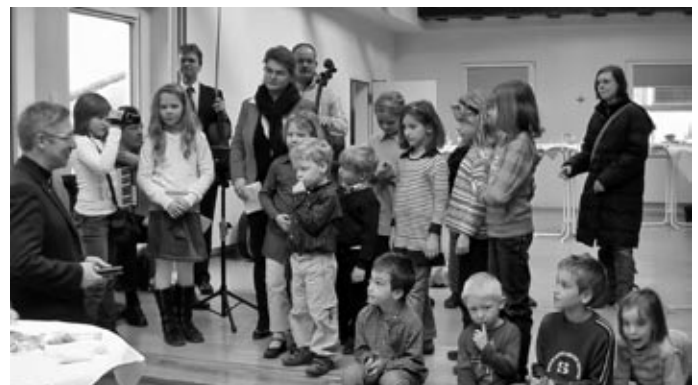
Die Kinder schenken zum Abschied ein Buch mit Erinnerungsfotos.