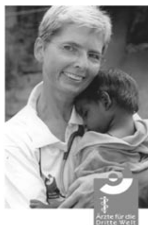
Ärzte für die Dritte Welt

Spendenkonto: EKK Bank BLZ 520 604 10 Konto-Nummer 48 88 88 0