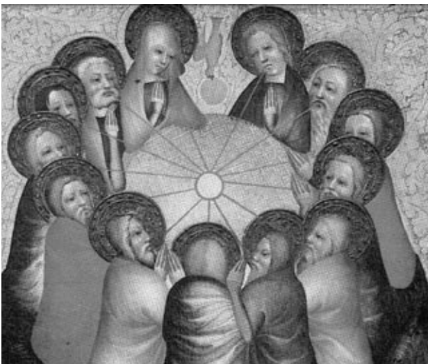
Bild: Ausgießung des Heiligen Geistes, Altar des Westfälischen Meisters, um 1370–80.