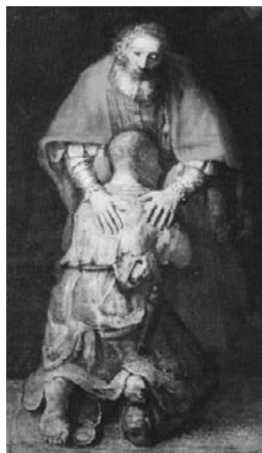
Ausschnitt aus dem Gemälde von Rembrandt um 1668/69, Leinwand, 2,62 x 2,06 m, St. Petersburg, Eremitage

Diese Gewissheit schenkt uns Gott durch den Bruder. Der Bruder zerreißt den Kreis der Selbsttäuschung. Wer vor dem Bruder seine Sünden bekennt, der weiß, dass er hier nicht mehr bei sich selbst ist, der erfährt in der Wirklichkeit des Anderen die Gegenwart Gottes. Solange ich im Bekenntnis meiner Sünden bei mir selbst bin, bleibt alles im Dunkeln, dem Bruder gegenüber muss die Sünde ans Tageslicht. Weil aber die Sünde einmal doch ans Licht muss, darum ist es