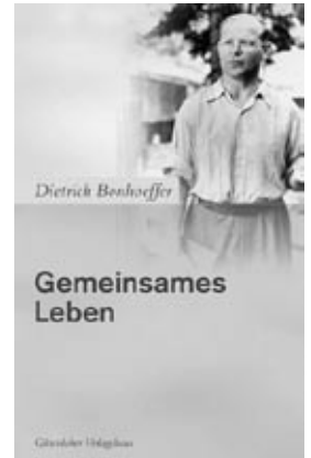
Dietrich Bonhoeffer: Gemeinsames Leben, Gütersloher Verlagshaus 2001, ISBN: 3579004522

So ergeht in der christlichen Gemeinschaft der Ruf zur brüderlichen Beichte und Vergebung als zu der großen Gnade Gottes in der Gemeinde.