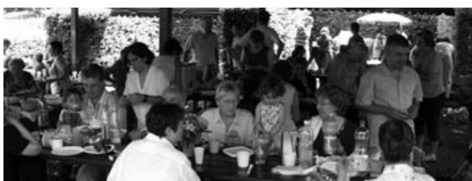
Seit 2005 lädt MET jedes Jahr zu einem Begegnungstag im Luisenpark ein. Hier ein Foto vom Treffen 2006.