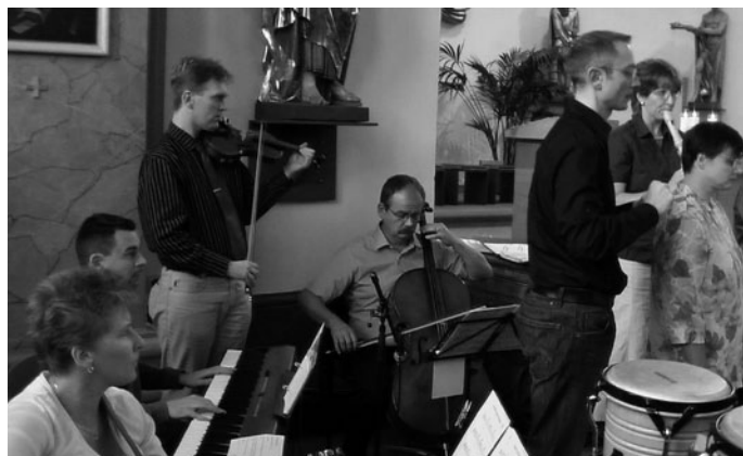
Das Musikteam beim Sonntagsgottesdienst in St. Sebastian