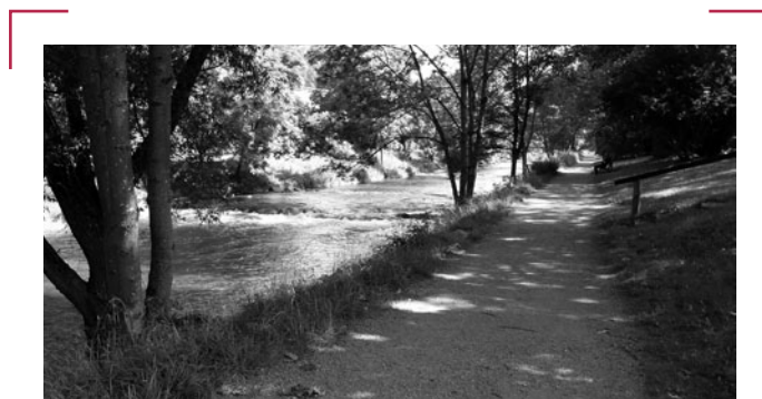
„Gottes Willen suchen gemäß dem Ziel unserer Berufung“ diese Formulierung der ersten Jesuiten gilt auch für den Berufungsweg von MET.