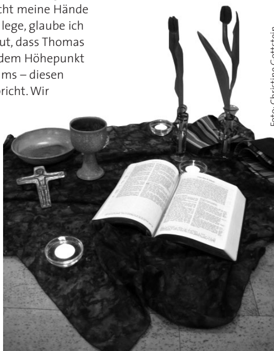
Dekoration beim Workshop Liturgie

„Aus apostolischer Überlieferung, die ihren Ursprung auf den Auferstehungstag Christi zurückführt, feiert die Kirche das Pascha-Mysterium (das Ostergeheimnis) jeweils am achten Tag des Herrn oder Herrentag genannt wird. An diesem Tag müssen die Christen zusammenkommen, um das Wort Gottes zu hören, an der Eucharistiefeier teilzunehmen und so des Leidens, der Auferstehung und der Herrlichkeit des Herrn Jesus Christus zu gedenken und Gott dankzusagen, der sie wiedergeboren hat in lebendiger Hoffnung durch die Auferstehung Jesu Christi von den Toten (1 Petrus 1,3). Deshalb ist der Herrentag der Ur-Feiertag, den man der Frömmigkeit der Gläubigen eindringlich vor Augen stellen soll, auf dass er auch ein Tag der Freude sei und der Muße. Andere Feiern sollen ihm nicht vorgezogen werden, wenn sie nicht wirklich von höchster Bedeutung sind; denn der Sonntag ist Fundament und Kern des ganzen liturgischen Jahres.“ ◀ bg